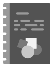
CADERNO e outros