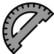
MATERIAL DE DESENHO GEOMÉTRICO

* A qualidade do material influi em um bom resultado no trabalho do aluno.