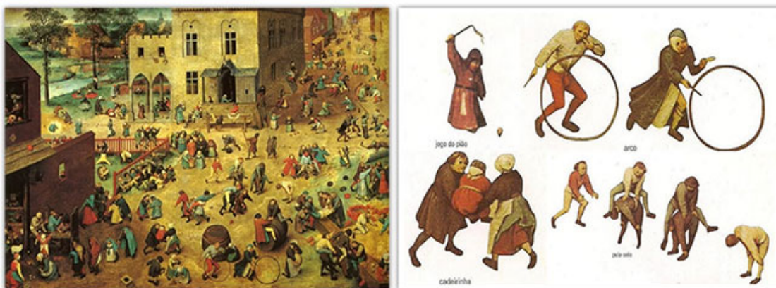
Jogos Infantis, Pieter Bruegel, 1560.

4. PERGUNTE PARA SEUS PAIS, QUAIS SÃO AS 4 BRINCADEIRAS ANTIGAS QUE ESTÃO REGISTRADAS NA PINTURA DE PIETER BRUEGHEL E REGISTRE NAS LINHAS ABAIXO.