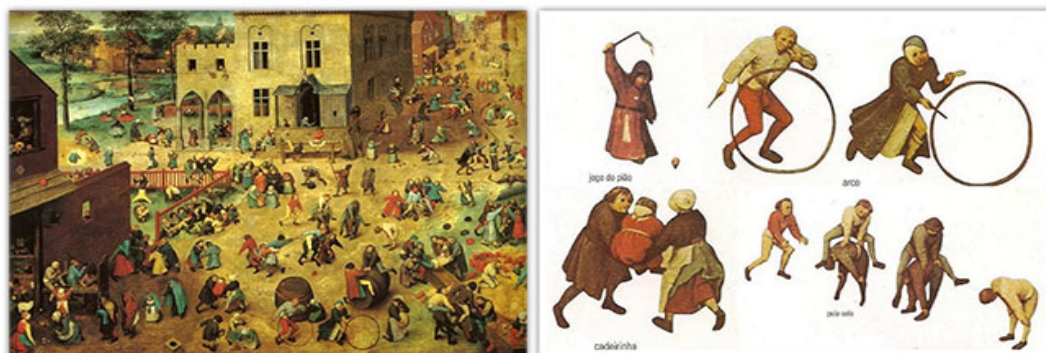
Jogos Infantis, Pieter Brueghel, 1560.

3. PERGUNTE A SEUS PAIS, QUAIS SÃO AS 4 BRINCADEIRAS ANTIGAS QUE APARECEM NA PINTURA DE PIETER BRUEGHEL E REGISTRE NAS LINHAS ABAIXO.