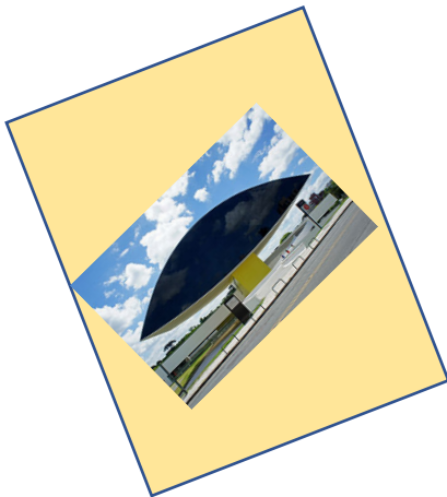
Museu Oscar Niemayer