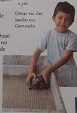
Gertrudis, a tartaruga