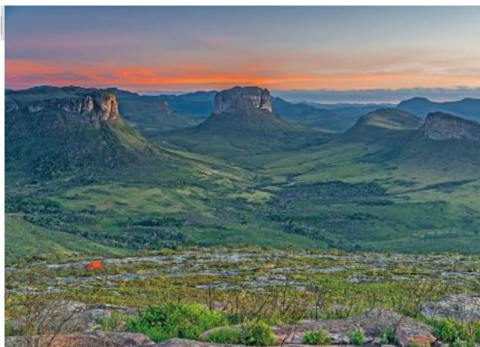
Paisagem no Parque Nacional da Chapada Diamantina, município de Palmeiras, estado da Bahia, em 2016.