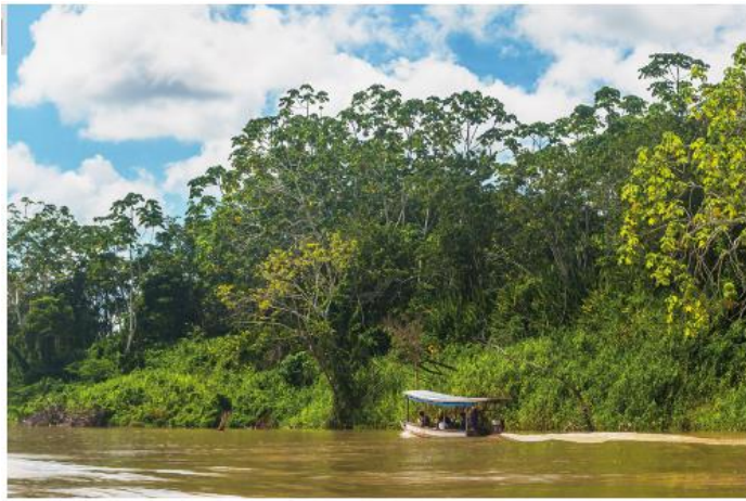
Paisagem no município de Tarauacá, estado do Acre, em 2017.