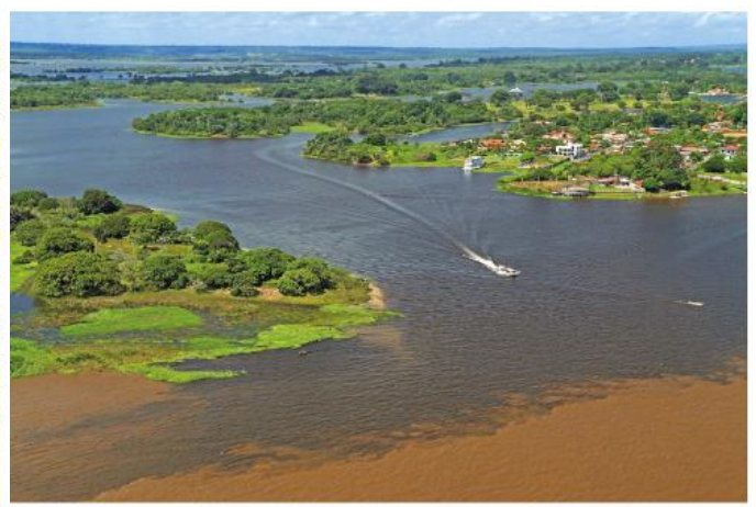
Município de Parintins, estado do Amazonas, em 2016.

1. Escreva o que mais chamou a sua atenção em cada imagem.