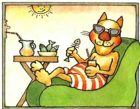
um gato contente